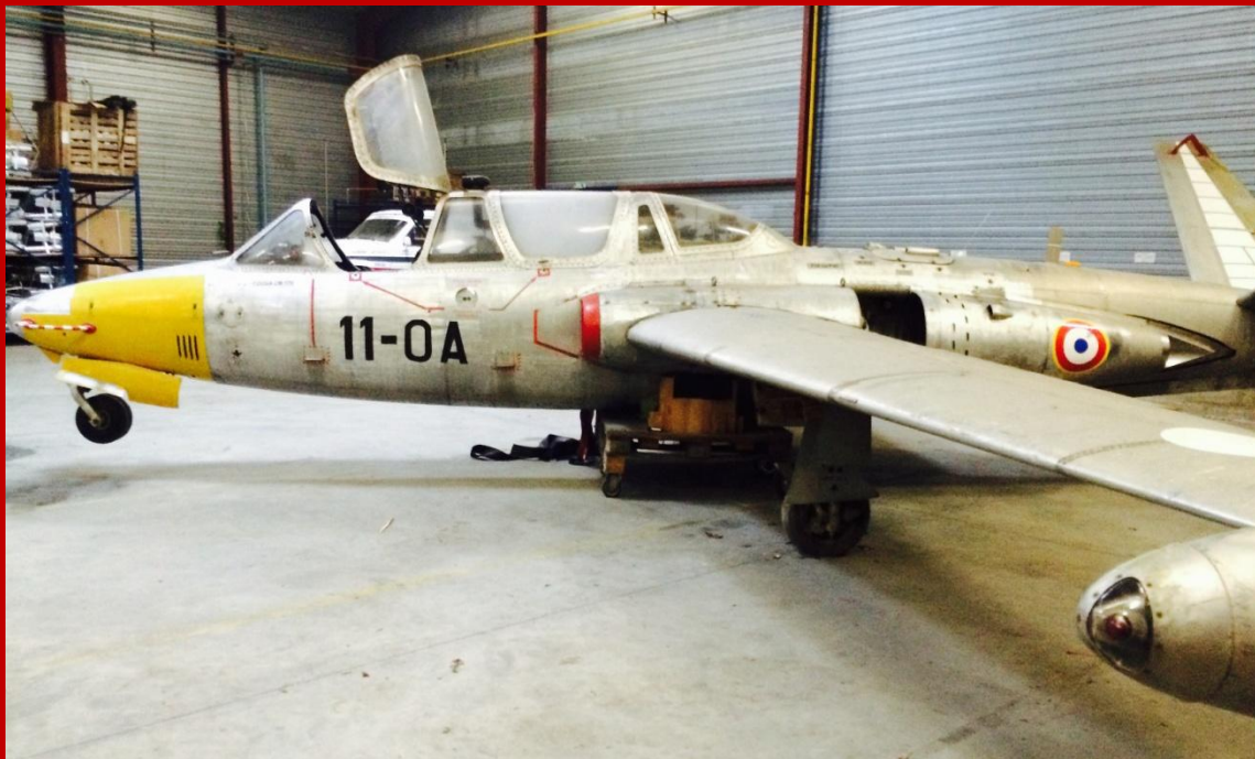
Avion de Chasse FOUGA-MAGISTER

CM 170 Fouga Magister n°6 (11-OA) – 11e Escadre de Chasse – Toulouse Déclassé de matériel de guerre à aéronef de collection et de présentation