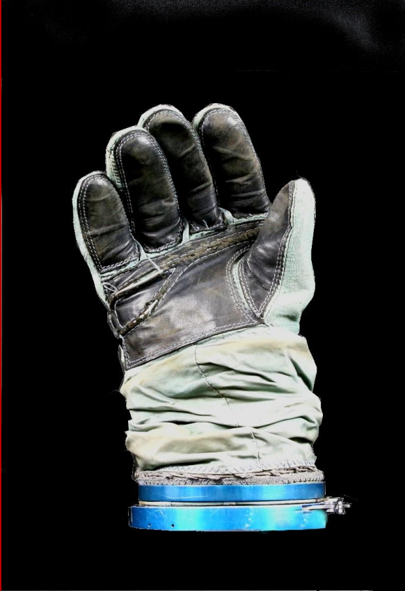
Gant de combinaison spatiale russe Strizh (équipage de la navette spatiale Buran), fin des années 1960

Cette configuration de la combinaison est extrêmement rare. Dans le cadre de ce programme, il a été décidé de développer une combinaison spécifique qui permet notamment de protéger le pilote en cas d'éjection à très haute altitude (jusqu'au 30 Km) et à très haute vitesse (Mach 3).