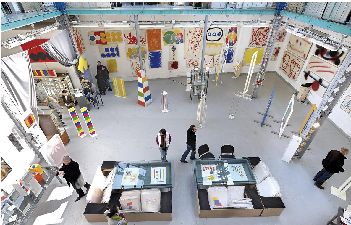
Exposition-vente d'art contemporain, Marseille.

En phase avec les évolutions technologiques, les salles de ventes proposent également « les ventes en live ». Une meilleure visibilité et une facilité supplémentaire pour les acquéreurs étrangers mais aussi pour un public jeune et dynamique pour lequel internet n'a plus de secret.