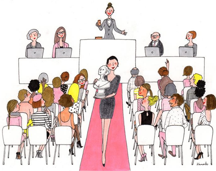
« Des femmes donnent aux femmes » Vente au profit de L'Institut Curie Paris, octobre 2012.

Ils mettent également leurs talents aux services de nobles causes en organisant des ventes caritatives.